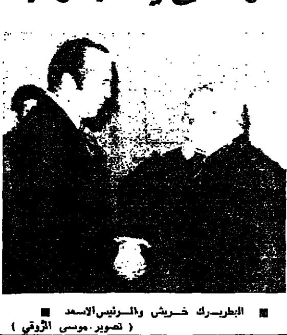
البطريرك خريش والرئيس الأسعد